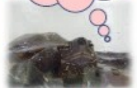
キャメロン※施設で飼育中