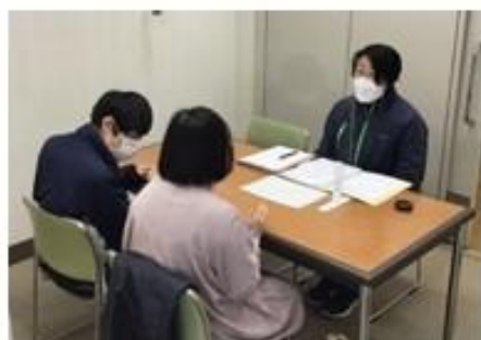
個別面談のようす みなさまのニーズに寄り添います。