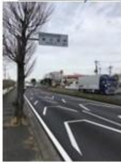
春日部方向から来た場合 16号国道 卸町交差点を右折