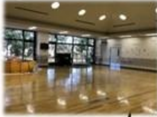
100人以上集まれる 多目的ホール