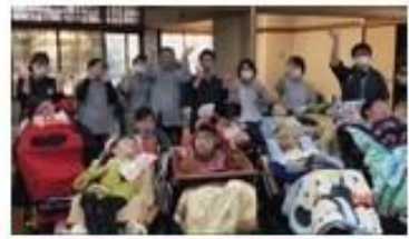
カシオペアグループ