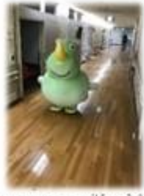
横幅297センチの広い廊下