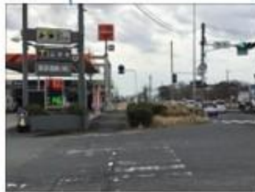
吉野町方向から来た場合 16号国道 卸町交差点を左折