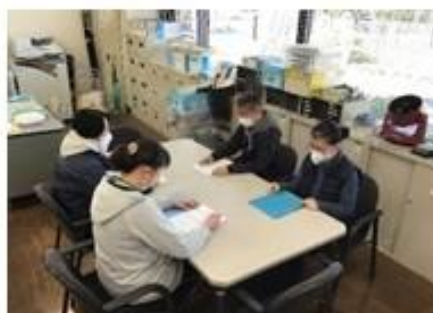
ケース会議のようす 様々な角度から検討します。