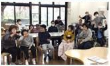
シリウスグループ