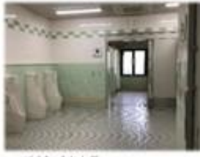
空調完備のトイレ