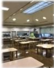
明るい雰囲気 の食堂