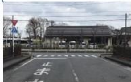
卸町交差点から 600m直進 T字路を右折後すぐ正門あり