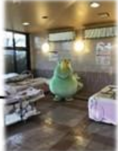
2台の機械浴槽でさっぱり