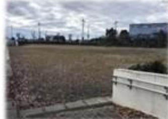
力いっぱい運動 ができるグラウンド