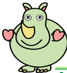
サイのたまちゃん

こんげつ きゅうかんび 今月の休館日 このか げつ たいいく ひ 9日(月)体育の日