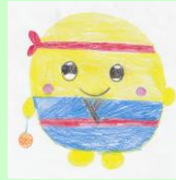
マスコットキャラクター コロ