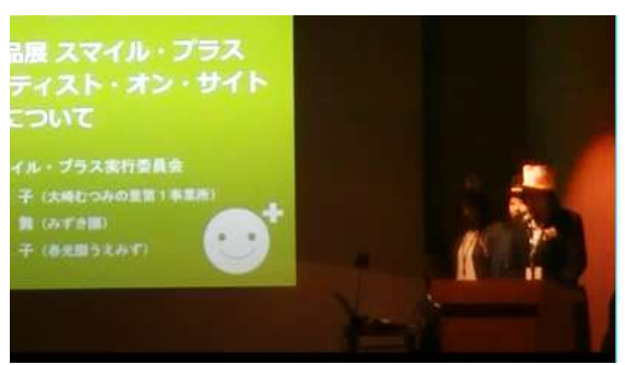
演題2 大崎むつみの里第1事業所・みずき園・春光園うえみず 『利用者作品展スマイル・プラス及びアーティスト・カ・サイトの取組みについて』