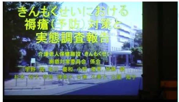
演題4 グリーンヒルうらわきんもくせい 『きんもくせいにおける褥瘡(予防)対策と実態調査報告』