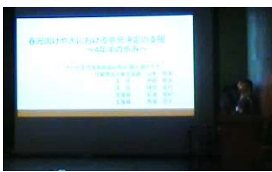
演題1 春光園けやき 『春光園けやきにおける意思決定支援～4年半の歩み～』