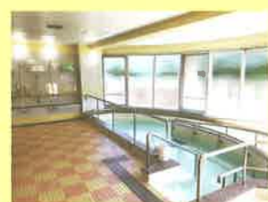
機械浴・チェアインバス・介助浴のタイプで、安全・快適に入浴していただけます。

管理栄養士が栄養管理をしています。ご利用者様にあった食形態を提供します。療養食対応、行事食も工夫しています。